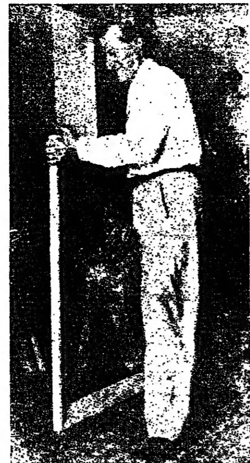
في مرمره عام ١٩٥٧

الواحد الفنية التي كانت شابة ، حين كان يؤسس أكاديمية الفنون التي خرجت أول ما خرجت جيل الفنانين الذين صنعوا من الربع القرن الماضي ، ابتداء من شقيق عميد وسيد ، عقل وفن الخال ، إلى أمين الباشا وحليم جردان ، وعارف الرئيس ، فإن من الواجب أن تكون أعمال قيصر الجليل في متناول الجميع يشاهدونها الجليل ونظمتها كل العيون اللبنانية . لقد كان من الضروري أن نتميز لهذا الفنان القليل القليل ما فعله لنا .